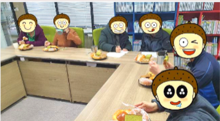
4분기 생활인 자치위원회 정기회의