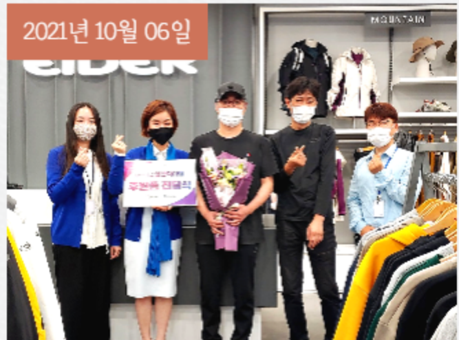
아이더 일산덕이점에서 가디건을 후원해 주셨습니다.