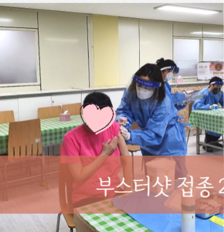
부스터샷 접종 2차