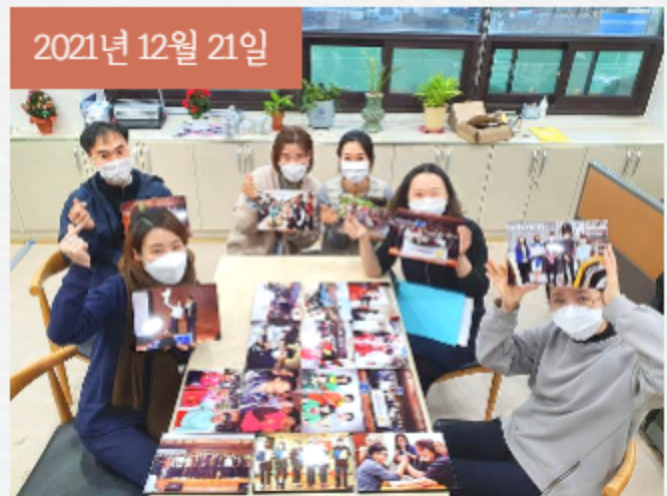
반딧불이학교에서 펄사이닝액자와 그림톡을 후원해주셨습니다.