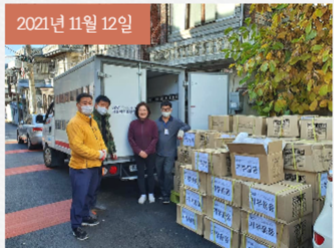
사회적협동조합 건강한세상에서 샴푸를 후원해주셨습니다.