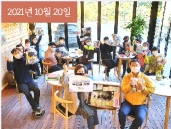
인플루언서 미싱꾼아내 및 회원분들이 방역물품을 후원해 주셨습니다.