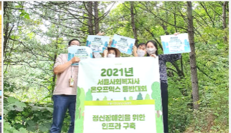
서울사회복지사 온오프믹스 등반대회