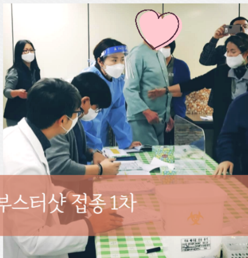
부스터샷 접종 1차