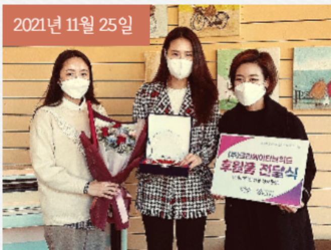
주식회사 크리에이티브워드(키라니아)에서 생필품을 후원해주셨습니다.